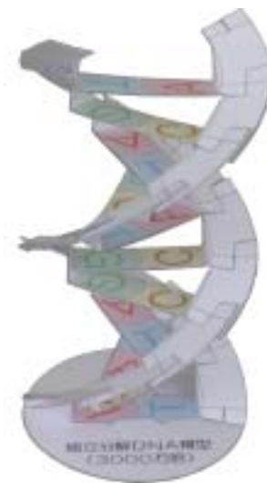
組立分解DNA模型 DNA簡易型 B (60mm) 兵庫県立尼崎西高校 吉田英一 http://www.venus.sanmet.ne.jp/eyoshida/